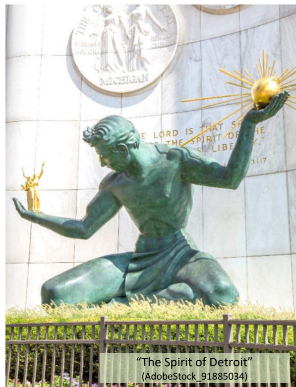
“The Spirit of Detroit”