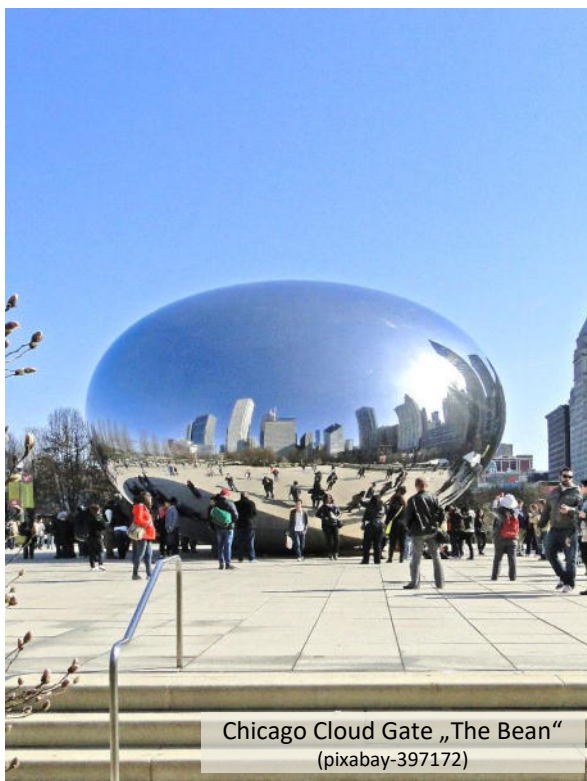
Chicago Cloud Gate „The Bean“